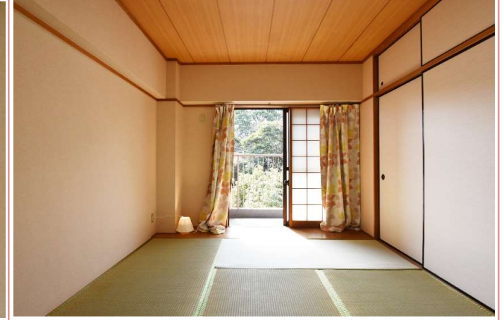
和室 ベランダから緑地が臨めます