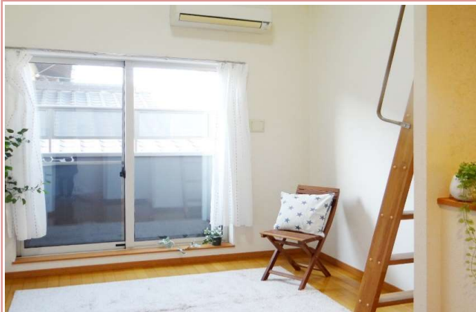
メゾネット+ロフト付で天井高になっております。