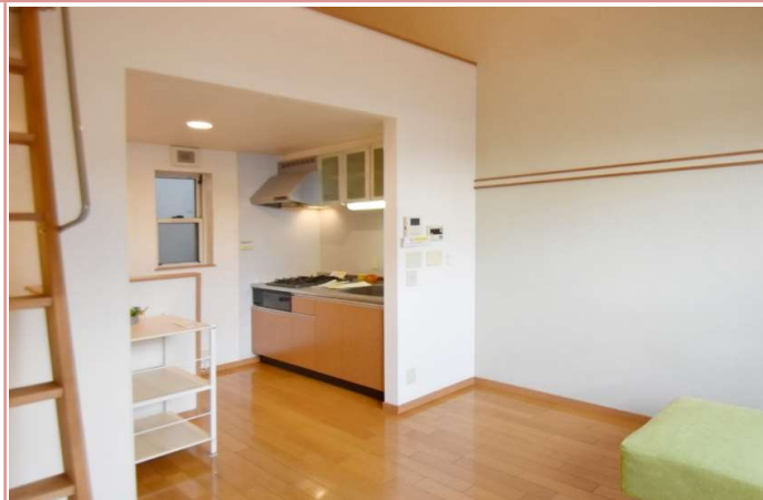
設備も充実しております。