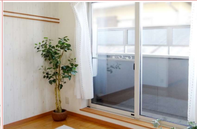
窓も大きめで光が良く入ります。

資料と現状に相違があった場合は、 現況を優先させていただきます 。お申込み等をされる場合は、 必ず現地確認を実施させていただきます ようお願いいたします。 管理会社 (株)アチーブメントプラス