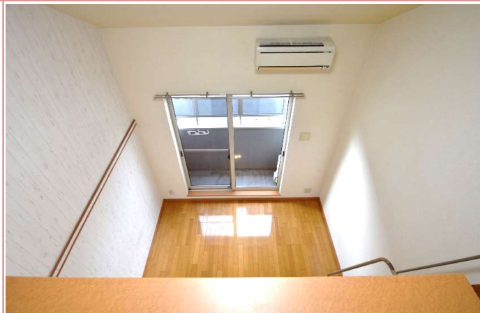
設備も充実しております。