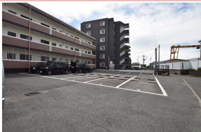
駐車場2台目も相談ください。