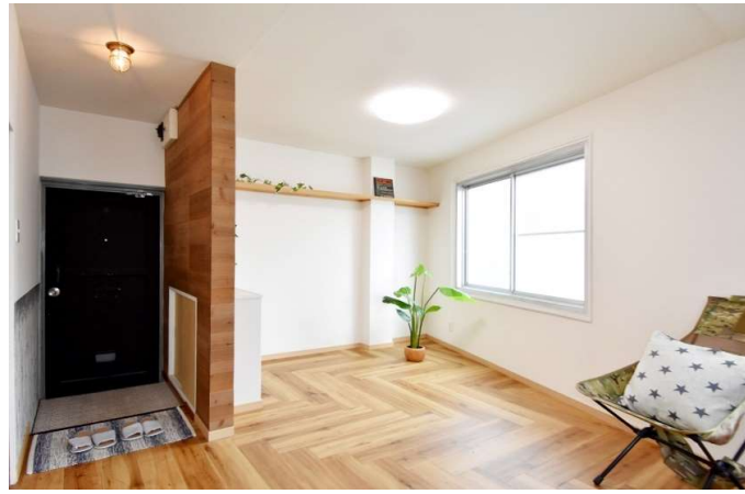
リビングスペース 東側から明るい光が差し込みます