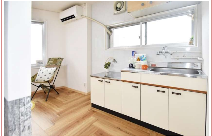
キッチン 開口があり明るいです