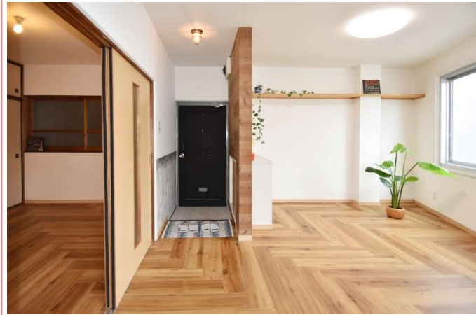
リビングスペース 元祖ヘリンボーン仕様の床です