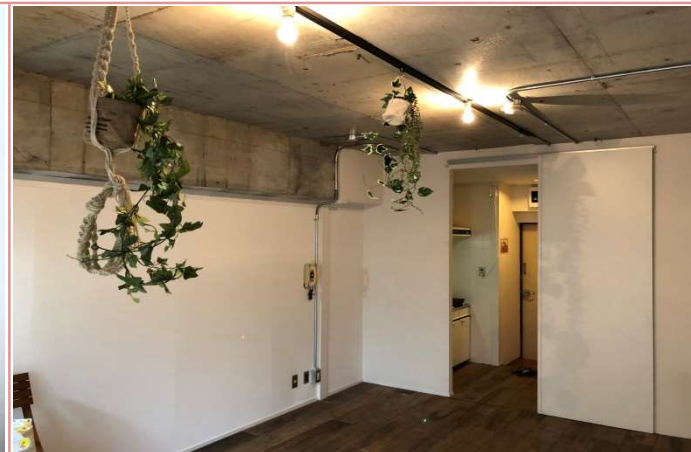
天井からグリーンを吊るしてみました☆雰囲気◎ ★入居前の状態です