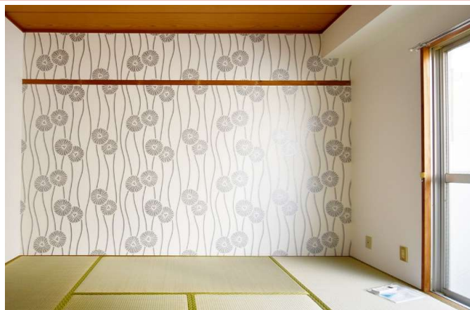
和の心、尊重します。 明るめのクロスを選びました。