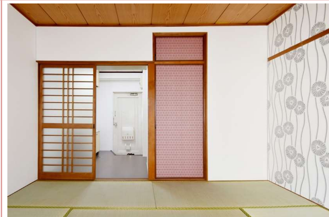
物入れのポイントカラー 天袋もあり季節物の収納に便利