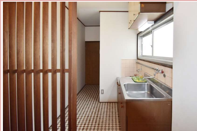
キッチン シンプルイズベスト