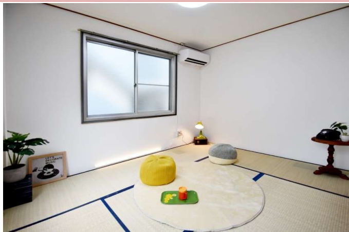
和室 畳はやはり落ち着きます