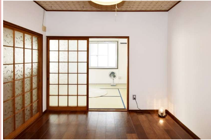
洋室 和室側へと続きます