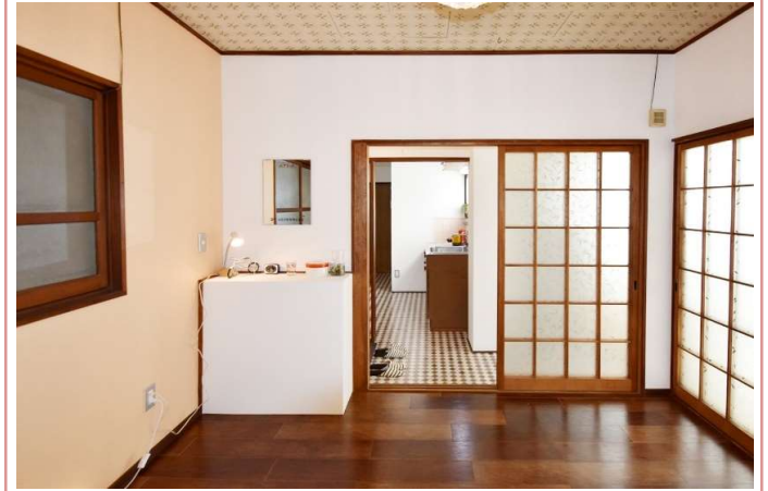
洋室 キッチンへの動線が良いです