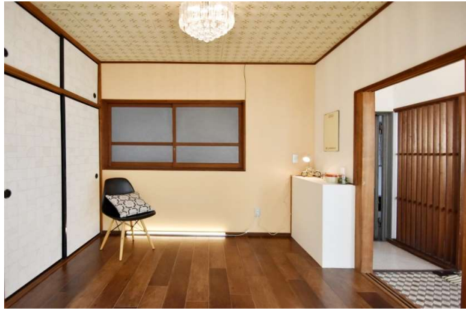
洋室 押入れあります