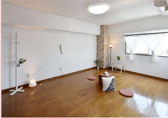
10畳あれば、色々な活用法があります！