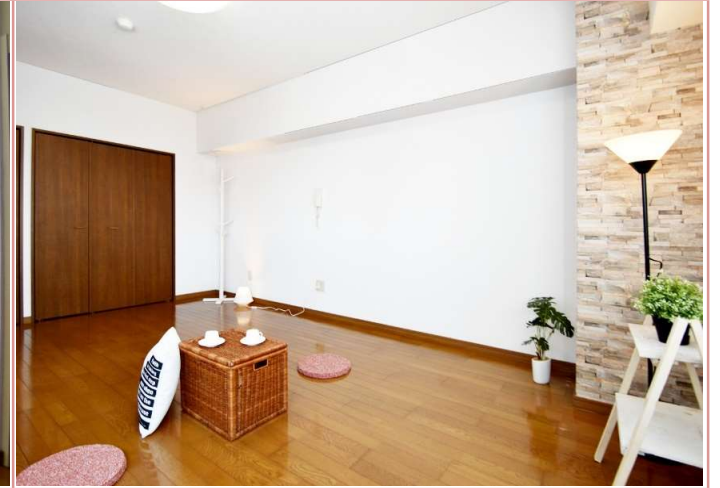
押入とクローゼットの夢の共演 ✿ 奥行きもあるので、収納タンスまですっばり♪