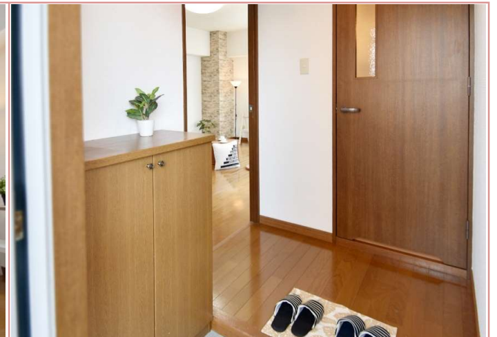
玄関の間口が広かって地味に嬉しい。