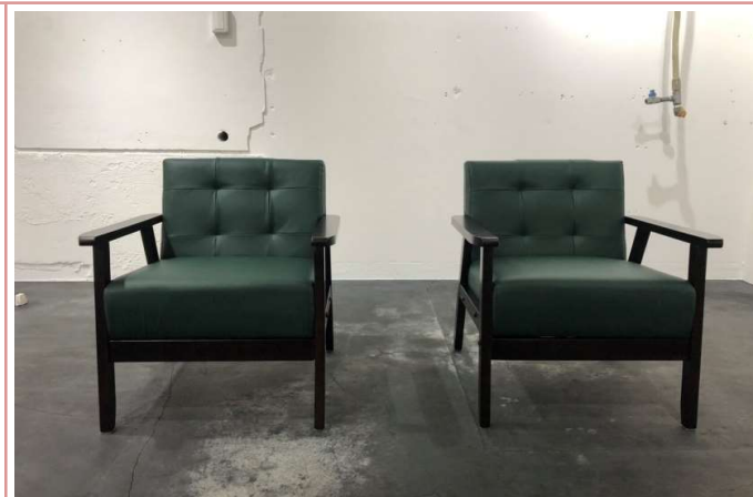
シックな家具が良く合います

資料と現状に相違があった場合は、 現況を優先させていただきます 。お申込み等をされる場合は、 必ず現地確認を実施させていただきます ようお願いいたします。 管理会社 (株)アチーブメントプラス