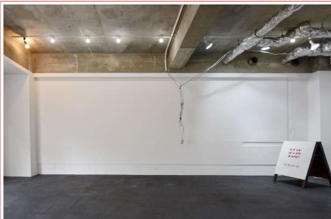
スッキリとした室内