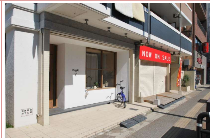
隣の店舗は美容室がございます。