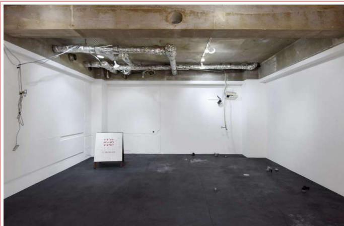
室内はスケルトン状態でのお引渡しとなります。