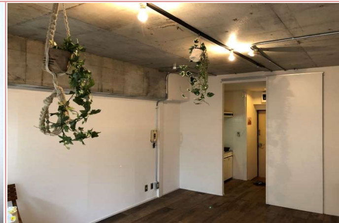
天井からグリーンを吊るしてみました☆雰囲気◎ ★入居前の状態です