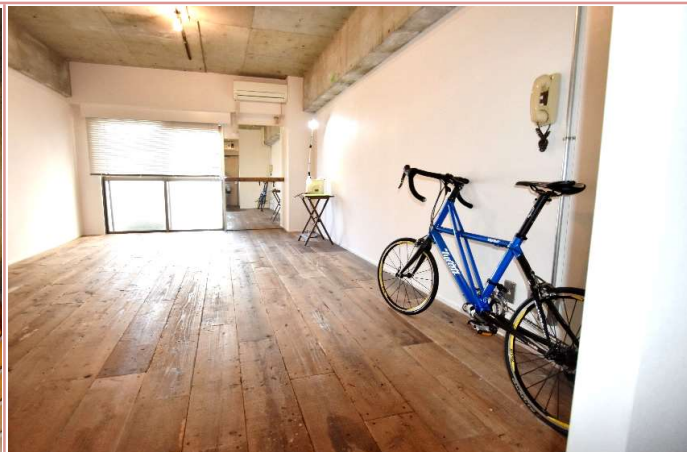
趣味部屋仕様に、仕上げては？