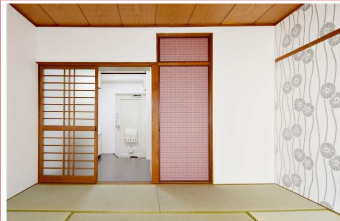
物入れのポイントカラー 天袋もあり季節物の収納に便利