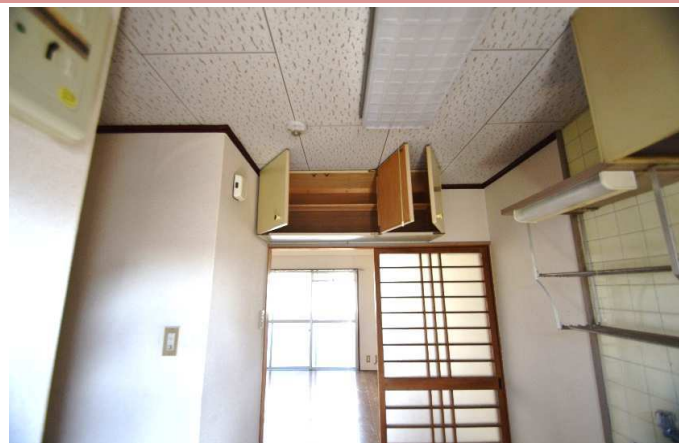
キッチン 上部収納もあります 駐車場 なし(近隣でお探しいたします。)