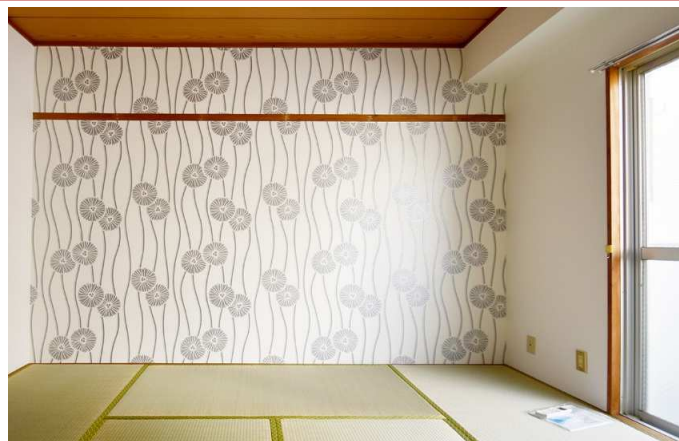
和の心、尊重します。 明るめのクロスを選びました。