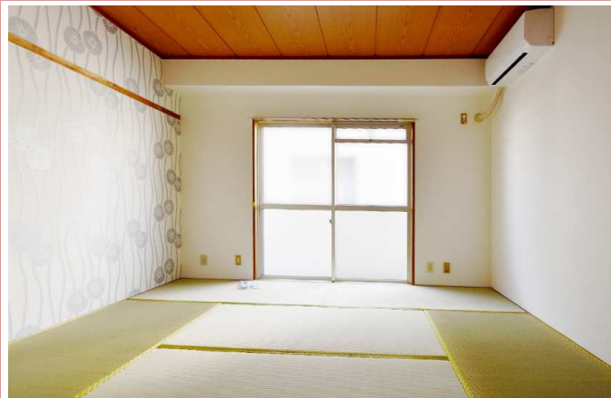
光もよく入ります。 エアコン新品です！