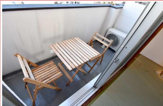
バルコニー※テーブルセットはつきません

資料と現状に相違があった場合は、 現況を優先させていただきます 。お申込み等をされる場合は、 必ず現地確認を実施していただきますようお願いいたします 。 管理会社 (株)アチーブメントプラス