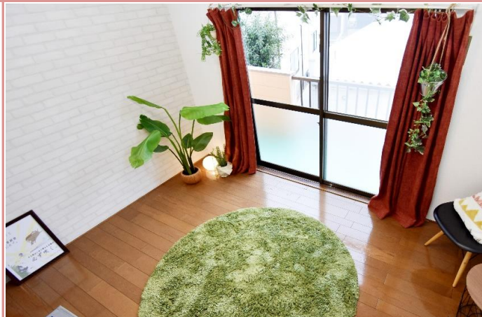
使い勝手や荷物の配置にも適した幅広タイプの洋間となっております。