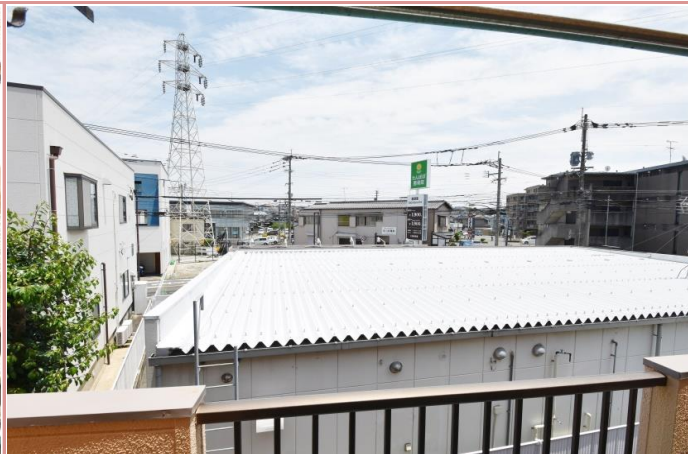
眺望良好で、視線を気にするものは御座いません。