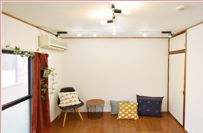
白を基調としたすっきりとしたお部屋です。