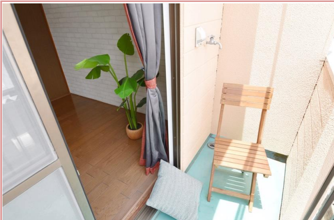
お部屋は風通しが良く、心地良い風が抜けていきます。