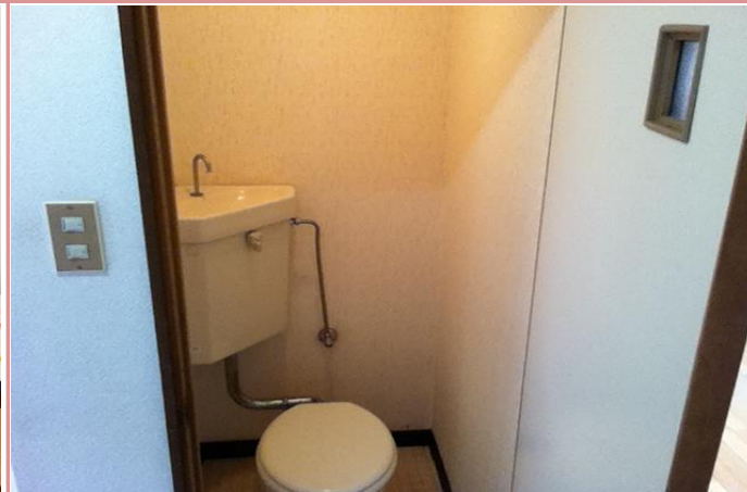
トイレ(バストイレ別)