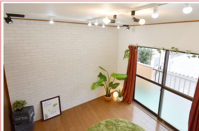
お部屋は風通しが良く、心地良い風が抜けていきます。 駐車場条件 駐車場無し(近隣に月極有り)