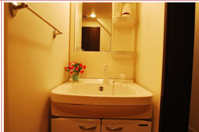
シャンプードレッサー