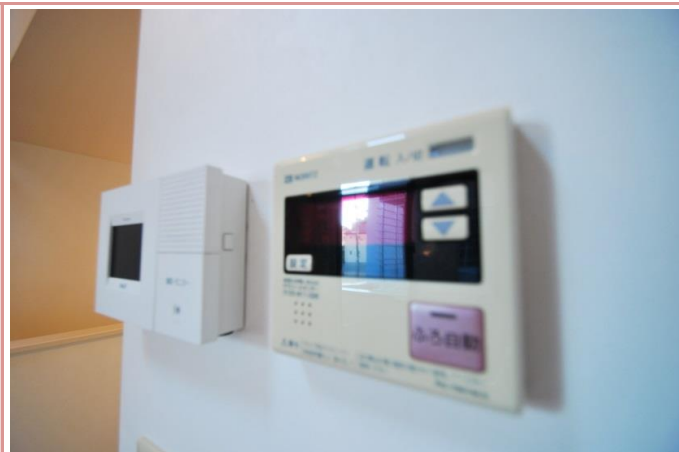
給湯器 ・ インターフォン