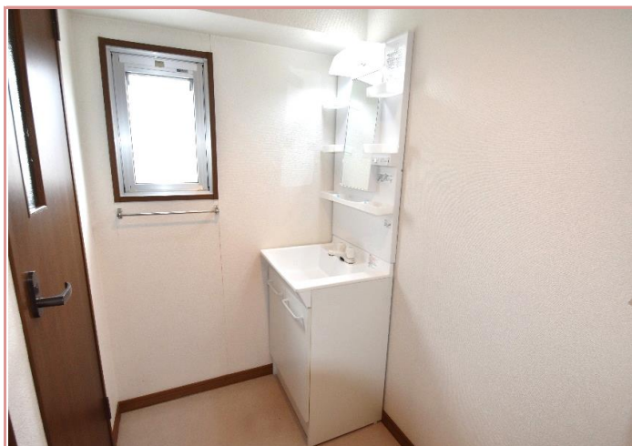
独立洗面脱衣所 もちろん室内洗濯機置場もあります☆