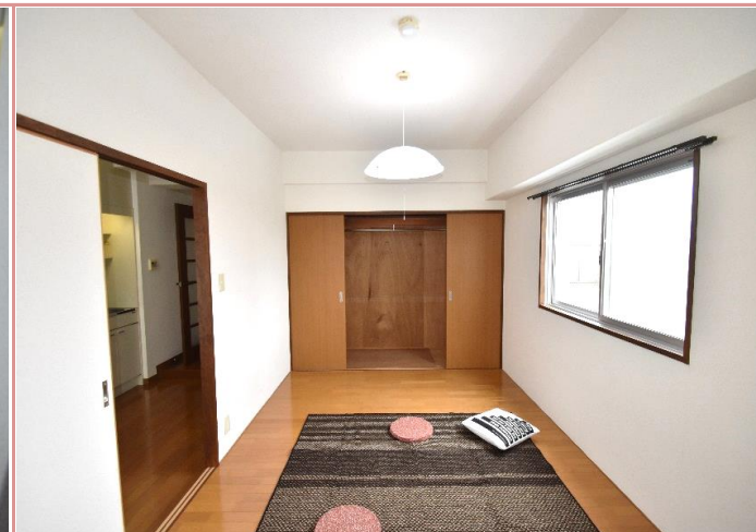
洋室・収納 収納の奥行に注目です！洋服もすっぽり収納♥