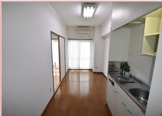
ダイニング部分 縦に長いお部屋は、何と言っても配置がし易い！