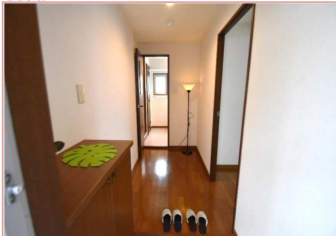
玄関～廊下部分 持て余すくらい広い廊下です！趣味の物を置いても◎