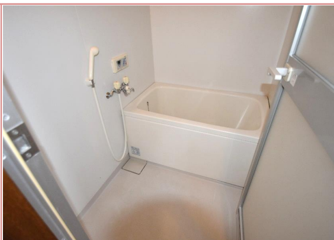
浴室 単身用の浴室とは思えない広さ！ゆったりつかれます♪