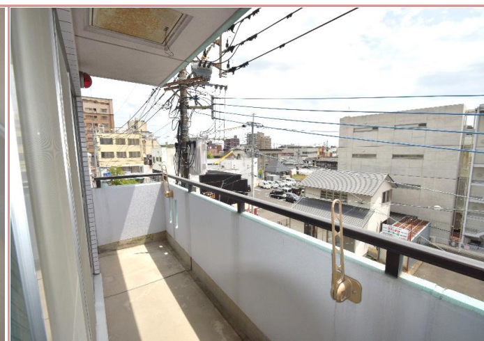
ベランダ 南向きで日当たり良好です◎

資料と現状に相違があった場合は、現況を優先させていただきます。お申込み等をされる場合は、必ず現地確認を実施していただきますようお願いいたします。 管理会社 (株)アチーブメントプラス