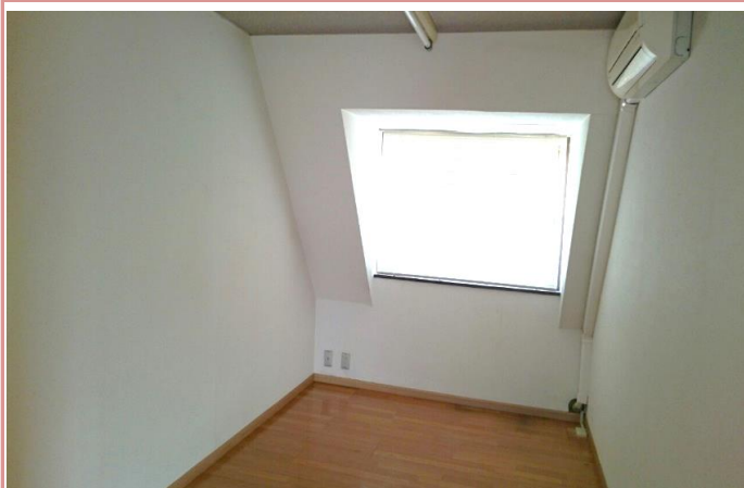
特徴的な天井の仕様がポイントの一つです。