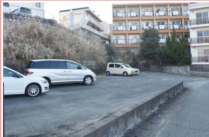
駐車場条件 駐車場 有