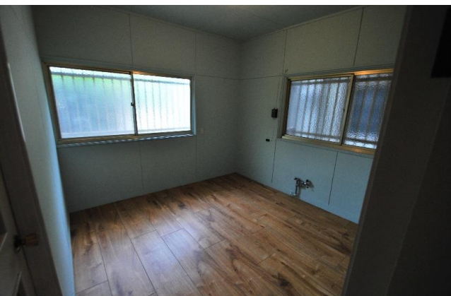
1F洋室 フロアタイル仕様