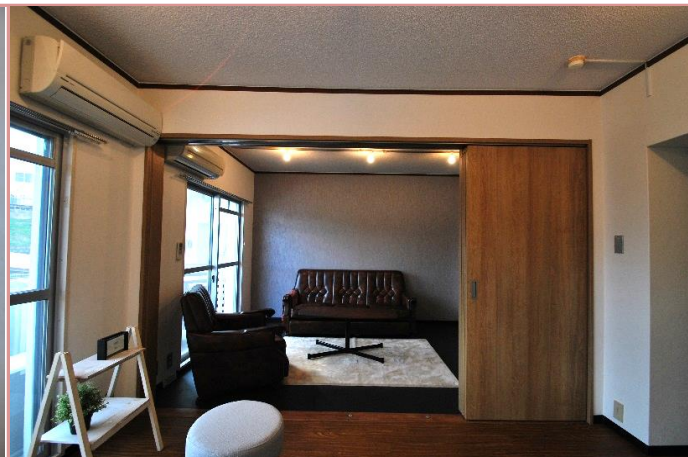
お部屋が仕切れます。