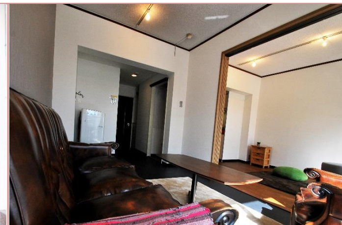
仕切らずにも使用できます。

資料と現状に相違があった場合は、 現況を優先させていただきます 。お申込み等をされる場合は、 必ず現地確認を実施させていただきます ようお願いいたします。 管理会社 (株)アチーブメントプラス