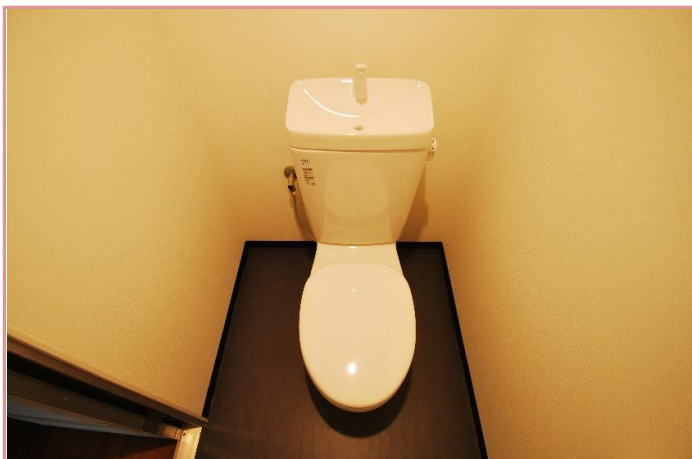
バス・トイレ別です!