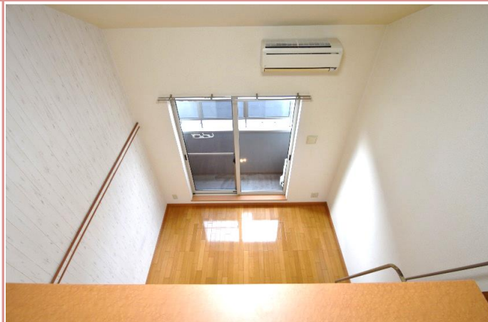
設備も充実しております。