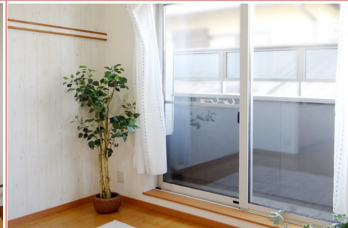
窓も大きめで光が良く入ります。

資料と現状に相違があった場合は、 現況を優先させていただきます 。お申込み等をされる場合は、 必ず現地確認を実施していただきますようお願いいたします 。 管理会社 (株)アチーブメントプラス