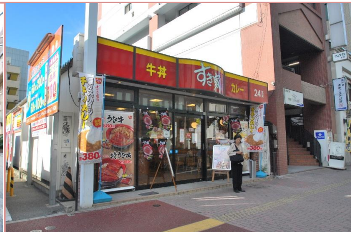
すき家まで徒歩1分

資料と現状に相違があった場合は、 現況を優先させていただきます 。お申込み等をされる場合は、 必ず現地確認を実施させていただきます ようお願いいたします。 管理会社 (株)アチーブメントプラス