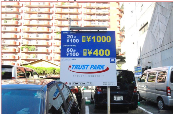
駐車場 なし/近隣に100パーキングあり