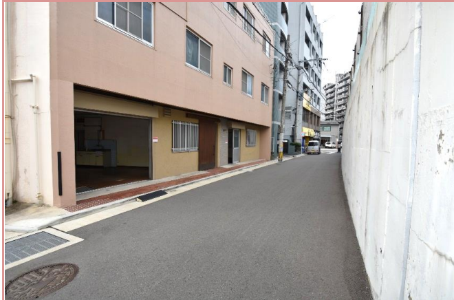
入口前通路 寄り付け・荷物の搬入がし易い！ 駐車場条件 近隣駐車場(月極)をご検討下さい