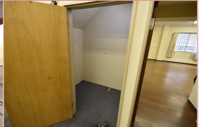
収納は奥行きがあり、大容量です！

資料と現状に相違があった場合は、 現況を優先させていただきます 。お申込み等をされる場合は、 必ず現地確認を実施していただきますようお願いいたします 。 管理会社 (株)アチーブメントプラス