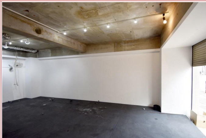
南に面しているため採光も取れます。

資料と現状に相違があった場合は、 現況を優先させていただきます 。お申込み等をされる場合は、 必ず現地確認を実施していただきますようお願いいたします 。 管理会社 株式会社 アーチーブメントプラス