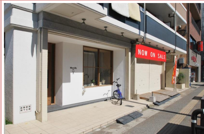
隣の店舗は美容室がございます。