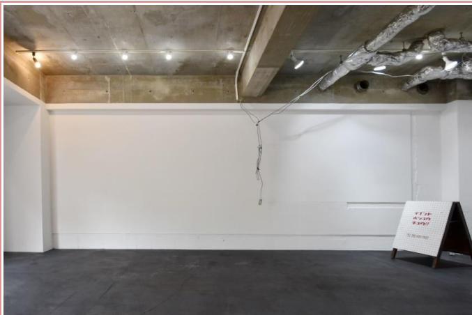
スッキリとした室内