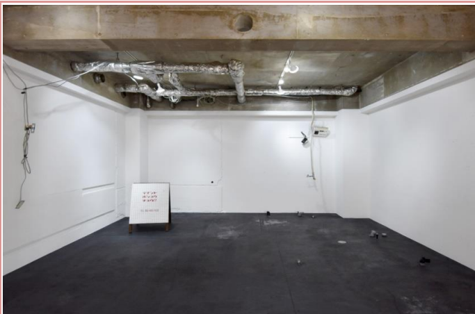
室内はスケルトン状態でのお引渡しとなります。