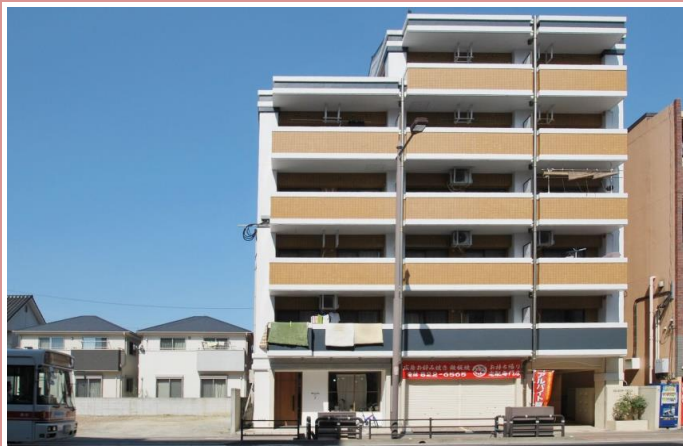
位置は1階部分向かって右側の店舗になります。