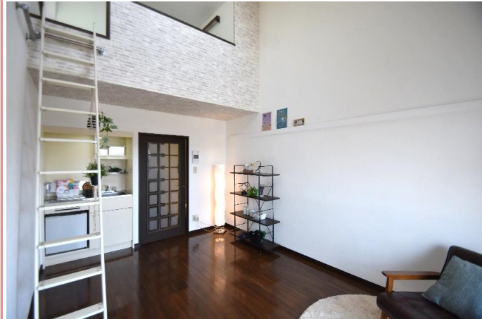
天井高でお部屋をさらに広く使えます♪