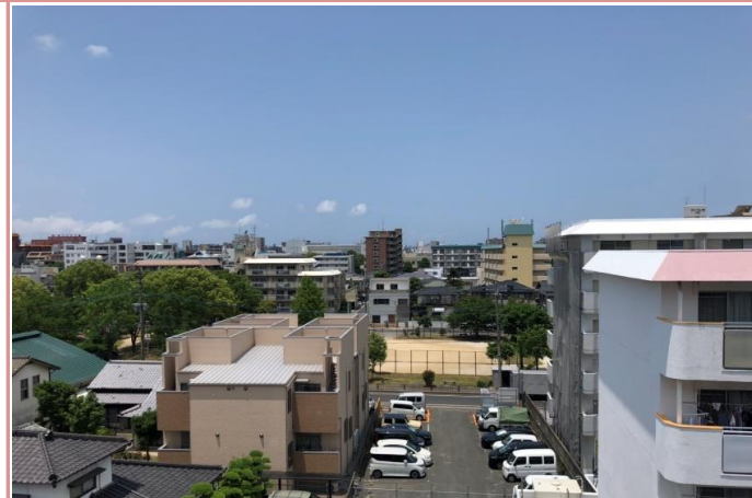
なんととってもこの眺望！