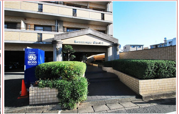
エントランス(郵便受けはダイヤルポストです)