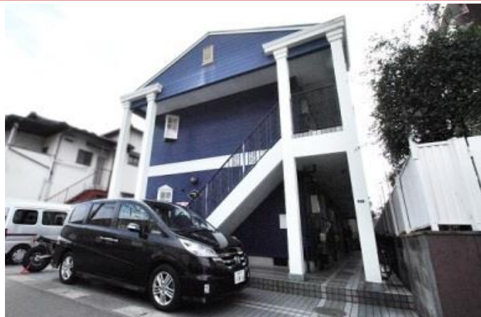
外観 駐車スペース