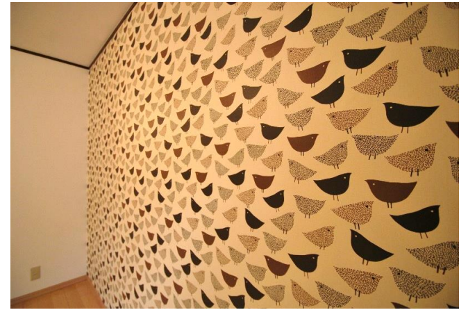
洋室 アクセントクロス