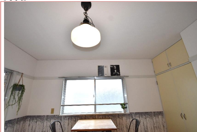
洋室 お洒落照明、設置しました！