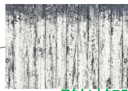
アクセントクロス