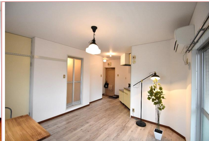
洋室 床材、変身したよ♪