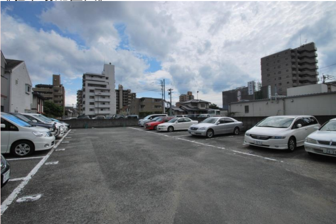
当マンションには駐車場がございませんが、最寄りには月極駐車場、コインPが多くございますのでご利用下さい