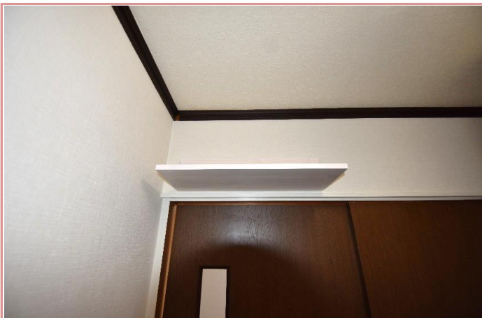
キッチンには上部棚を設置しました！ 駐車場条件 駐車場無し(近隣に月極有り)