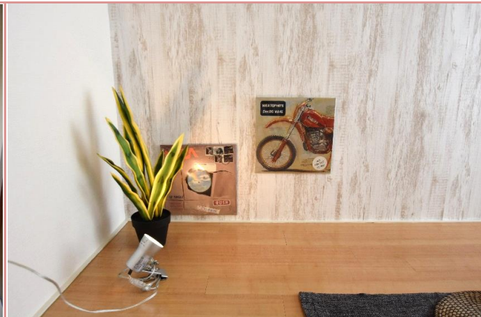
お好みで、間接照明を照らしては如何？ 落ち着いた空間が出来上がり！