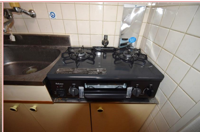
2口コンロをプレゼント！新品です♪

資料と現状に相違があった場合は、 現況を優先させていただきます 。お申込み等をされる場合は、 必ず現地確認を実施させていただきます ようお願いいたします。 管理会社 株式会社 アーチーブメントプラス