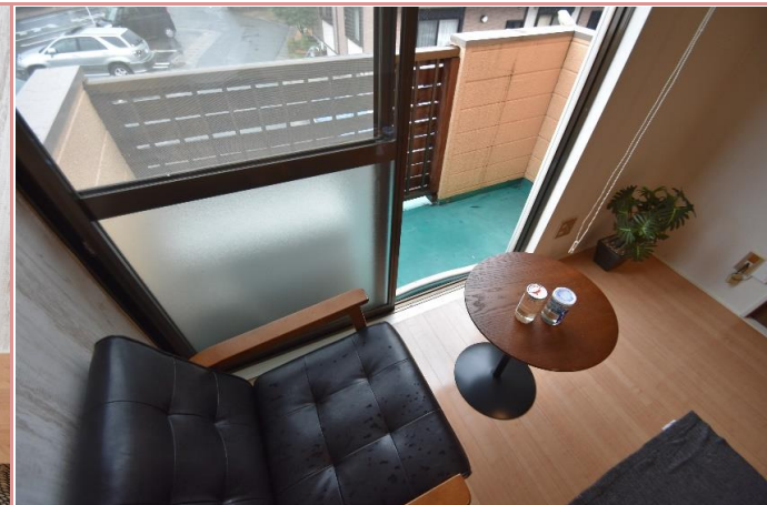
窓辺で1杯、どうぞ!!(アルコールor tea?)