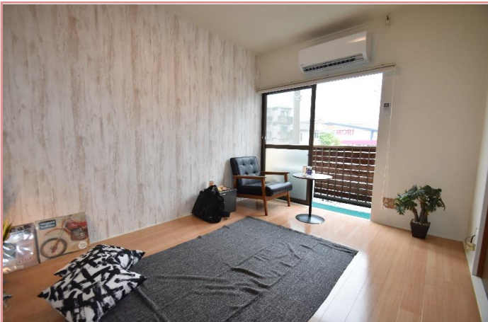
清潔な色合いの1000番クロスを採用しました。 量産クロスと違った、高級感を感じます↓