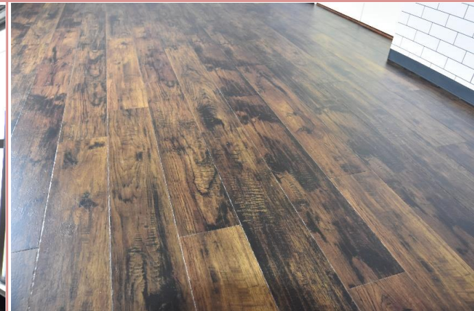
洋室 床材を新調しました。マットに仕上がってます。