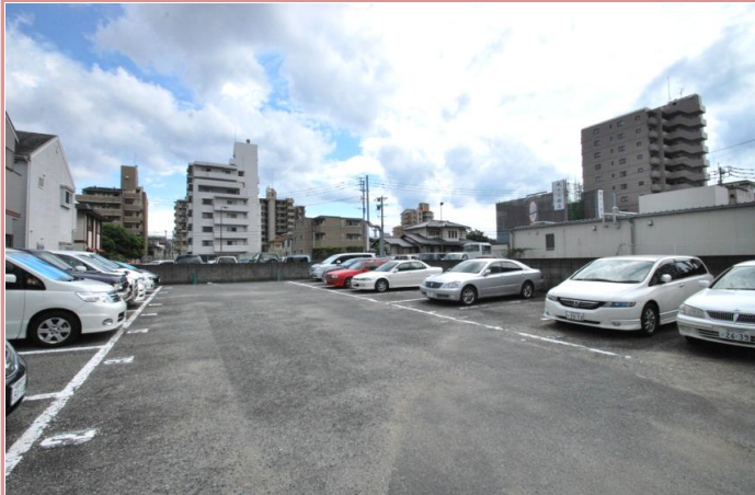
当マンションには駐車場がございませんが、最寄りには月極駐車場、コインPが多くございますのでご利用下さい