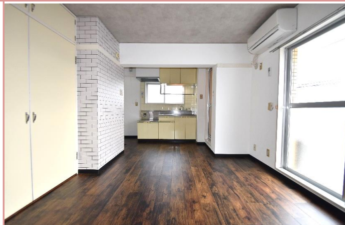
洋室 キッチンには窓があります。