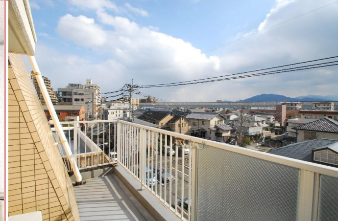
眺望もすばらしいです

資料と現状に相違があった場合は、 現況を優先させていただきます 。お申込み等をされる場合は、 必ず現地確認を実施させていただきます ようお願いいたします。 管理会社 (株)アチーブメントプラス