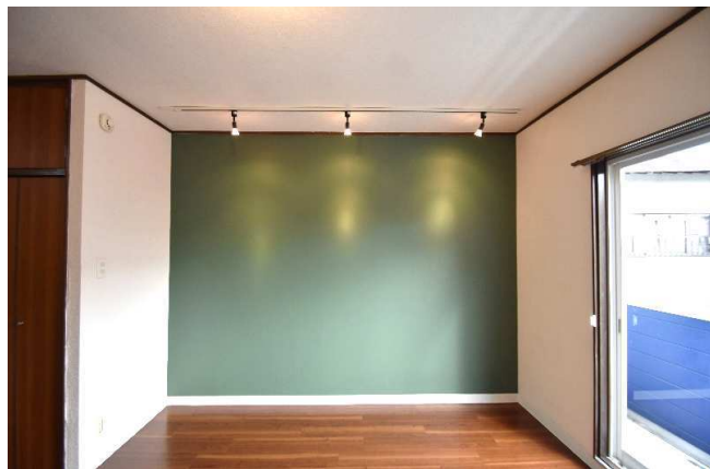
ライティングレール