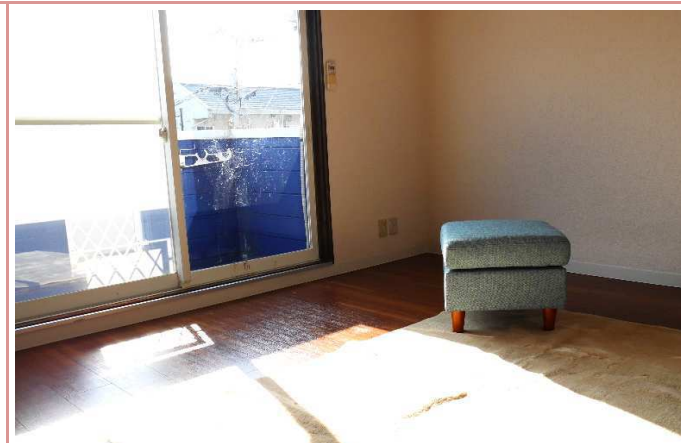
日もよく入ります。

資料と現状に相違があった場合は、 現況を優先させていただきます 。お申込み等をされる場合は、 必ず現地確認を実施させていただきます ようお願いいたします。 管理会社 (株)アチーブメントプラス