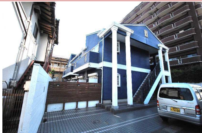
外観 駐車スペース 建物全面になります。 駐車場条件 軽1台(6,000円+税) 満車