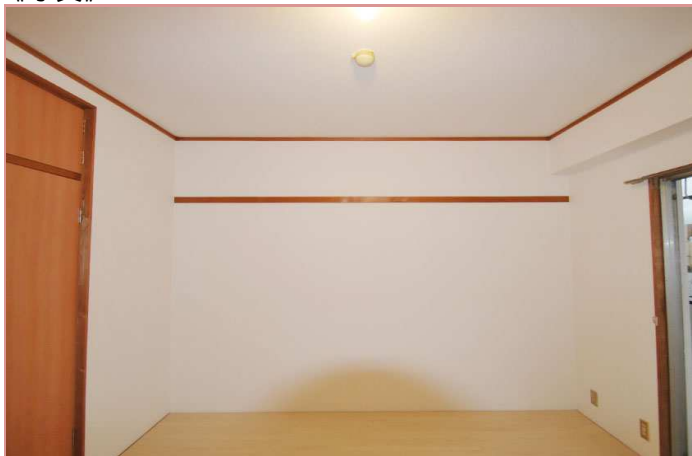
配置しやすい8畳の洋室へ変更予定！