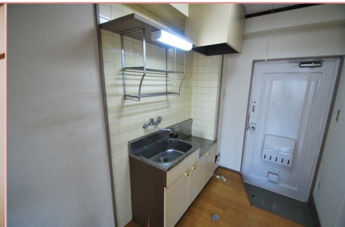
ゆったりしたキッチンスペース◎