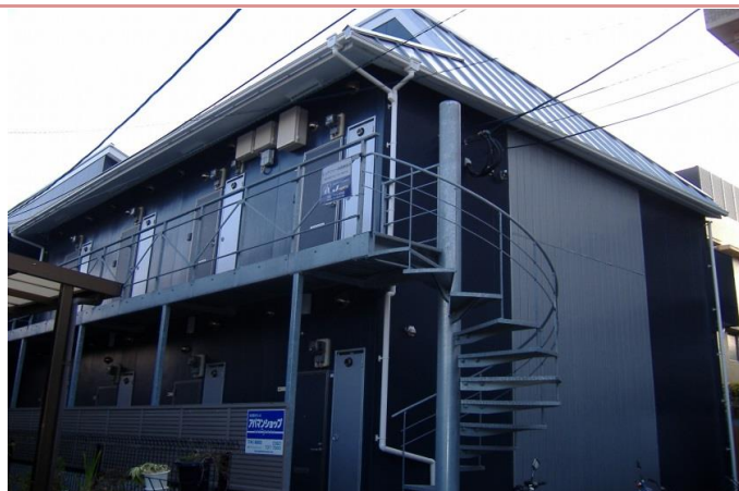
2階へは螺旋階段です