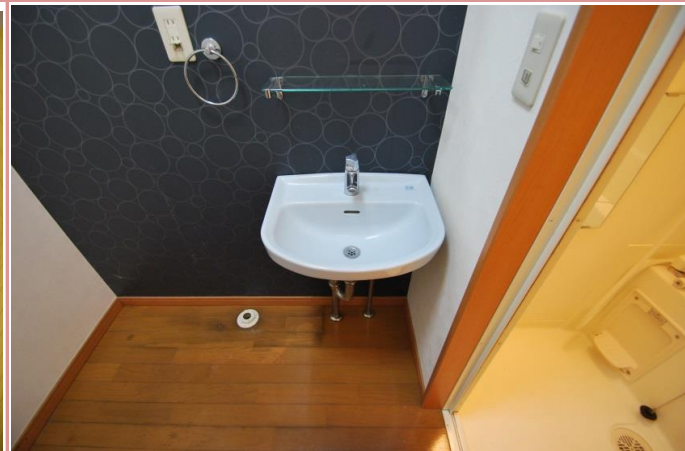
スマートながら清潔感はばっちりです☆