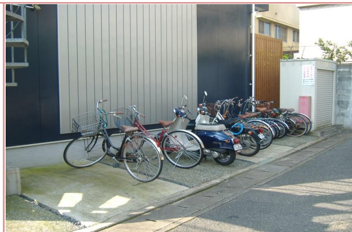
駐輪場もあります。

資料と現状に相違があった場合は、 現況を優先させていただきます 。お申込み等をされる場合は、 必ず現地確認を実施させていただきます ようお願いいたします。 管理会社 株式会社 アーチーブメントプラス