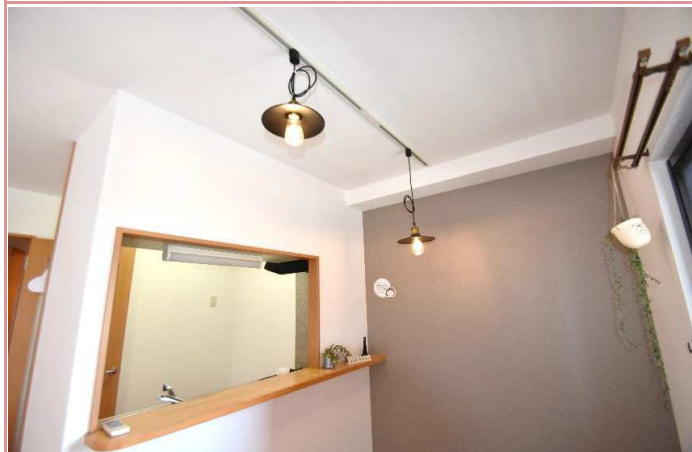
カウンター 照明、プレゼント！