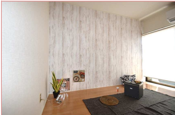
清潔な色合いの1000番クロスを採用しました。 量産クロスと違った、高級感を感じます↓