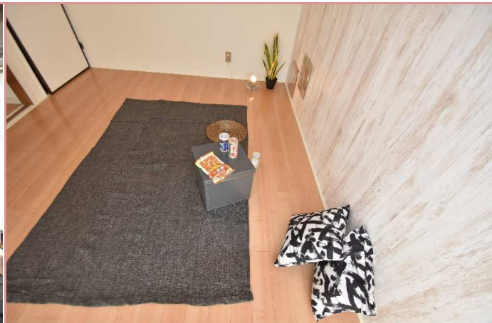
飲み部屋仕様に変身☆ ゆっくりくつろげる空間です。