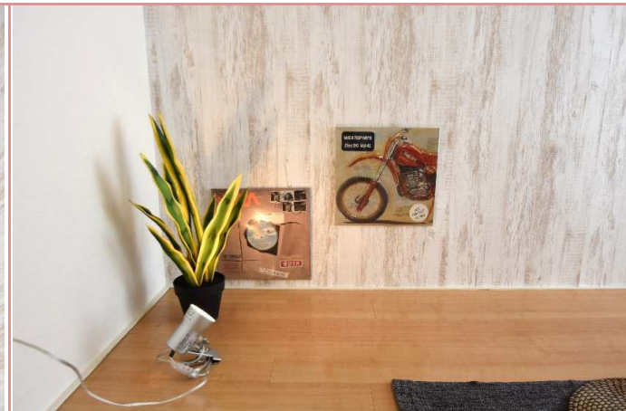
お好みで、間接照明を照らしては如何？ (写真はスタッフ私物)