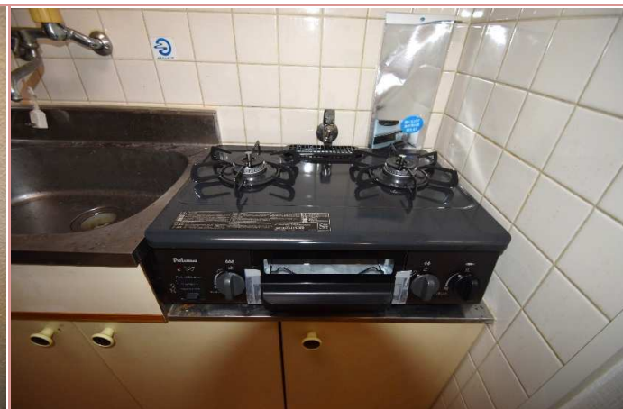
2口コンロをプレゼント！新品です♪

資料と現状に相違があった場合は、 現況を優先させていただきます 。お申込み等をされる場合は、 必ず現地確認を実施していただきますようお願いいたします 。 管理会社 ㈱アチーブメントプラス