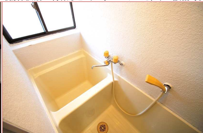
浴室にも窓があります☆