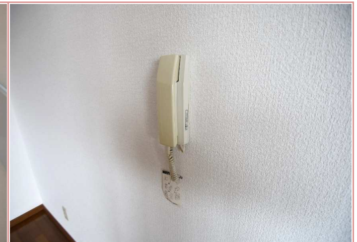
インターフォン 言わずと知れた何某。あると便利です◎

資料と現状に相違があった場合は、現況を優先させていただきます。お申込み等をされる場合は、必ず現地確認を実施していただきますようお願いいたします。 管理会社（株）アチーブメントプラス