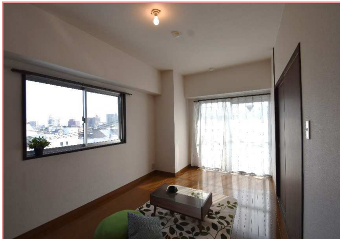
洋室（窓：東向き☀ ベランダ：南向き☀） 眺望も日当たりも申し分無しのお部屋です！