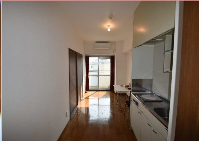
ダイニング部分 ※ 照明はついておりません 縦に長いお部屋は、何と言っても配置がし易い！