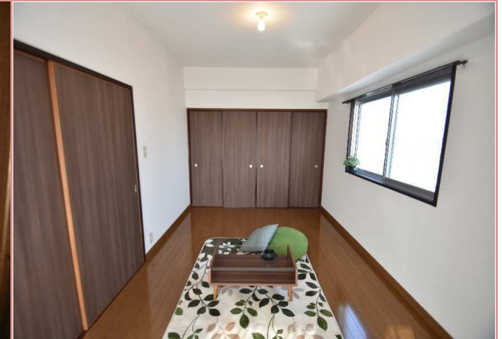
洋室・収納 収納の奥行に注目です！洋服もすっぽり収納❤️