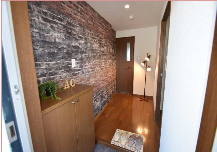
玄関～廊下部分 持て余すくらい広い廊下です！趣味の物を置いても◎