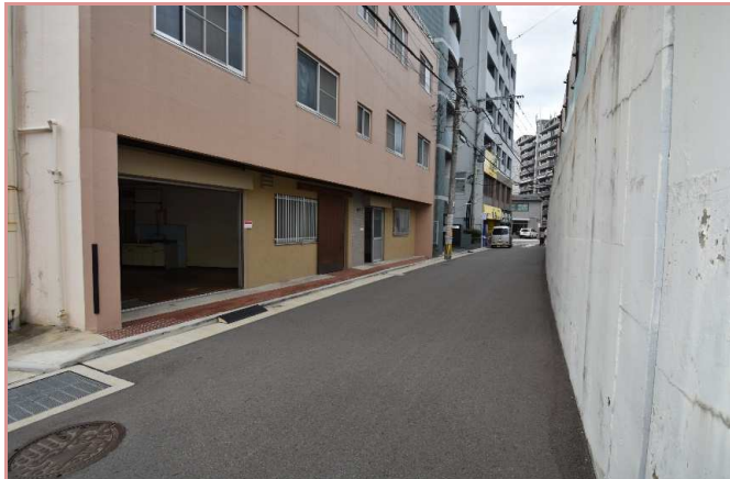
入口前通路 寄り付け・荷物の搬入がし易い！ 駐車場条件 近隣駐車場(月極)をご検討下さい