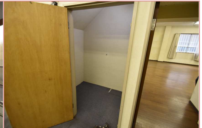
収納は奥行きがあり、大容量です！

資料と現状に相違があった場合は、 現況を優先させていただきます 。お申込み等をされる場合は、 必ず現地確認を実施していただきますようお願いいたします 。 管理会社 (株)アチーブメントプラス