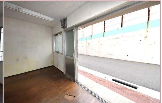
入口ドアは3枚とも引き込めます!シャッター付き!

資料と現状に相違があった場合は、 現況を優先させていただきます 。お申込み等をされる場合は、 必ず現地確認を実施していただきますようお願いいたします 。 管理会社 (株)アチーブメントプラス