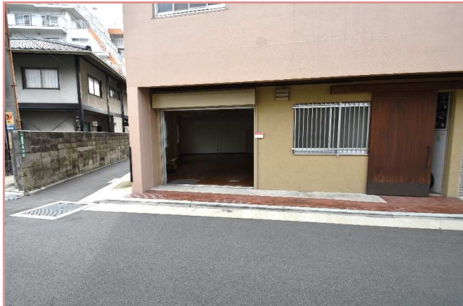
入口正面 寄り付け・荷物の搬入がし易い! 駐車場条件 近隣駐車場(月極)をご検討下さい