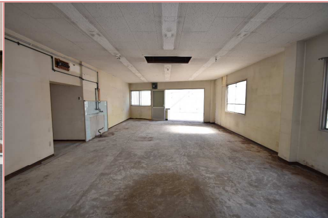
南側より 奥行がある空間です♪