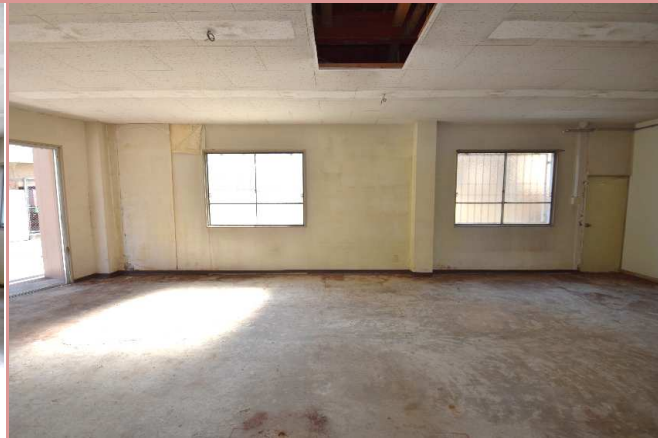
窓側(南東) 採光もバッチリです☀