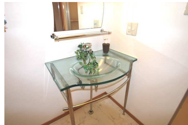
ガラスの洗面台です！