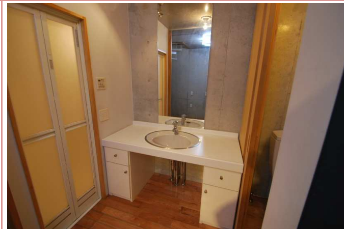
洗面台もオシャレです！！