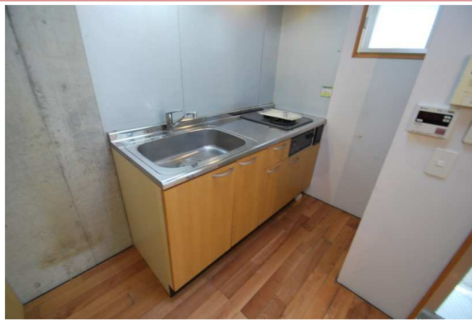
ビルトインコンロ付