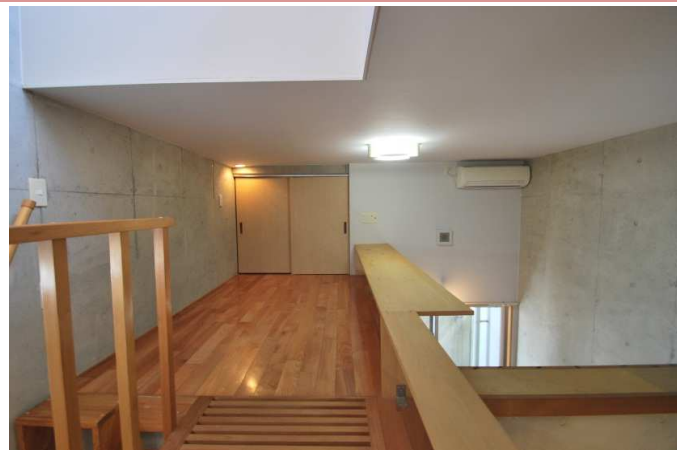
ロフト付、収納有です。