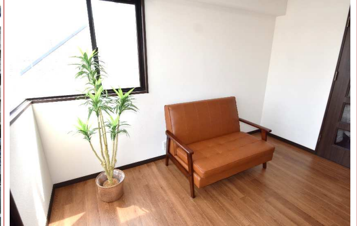
ソファ、プレゼント！