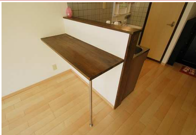
洋室 シンプルなクロスに仕上げました