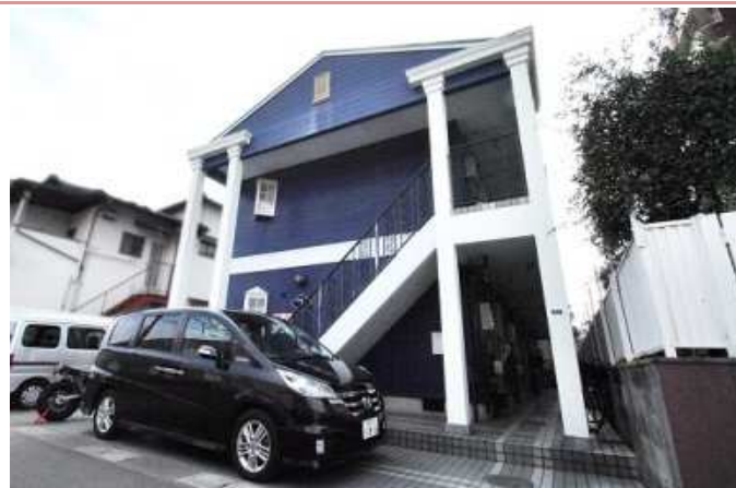
外観 駐車スペース