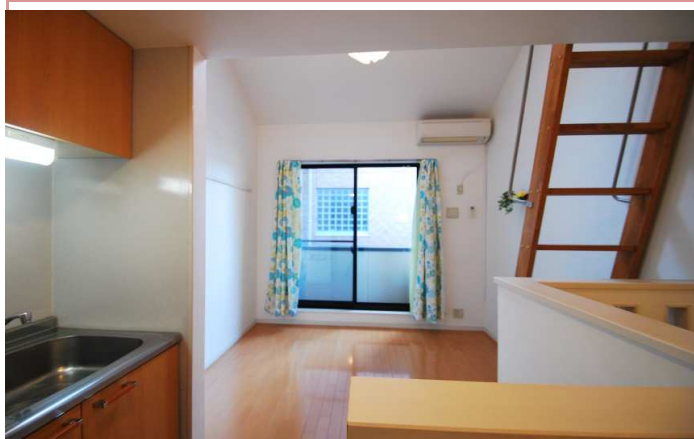
白を貴重とした明るいお部屋です。