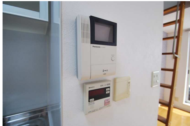
設備も充実してます。

資料と現状に相違があった場合は、 現況を優先させていただきます 。お申込み等をされる場合は、 必ず現地確認を実施させていただきます ようお願いいたします。 管理会社 株式会社アチーブメントプラス