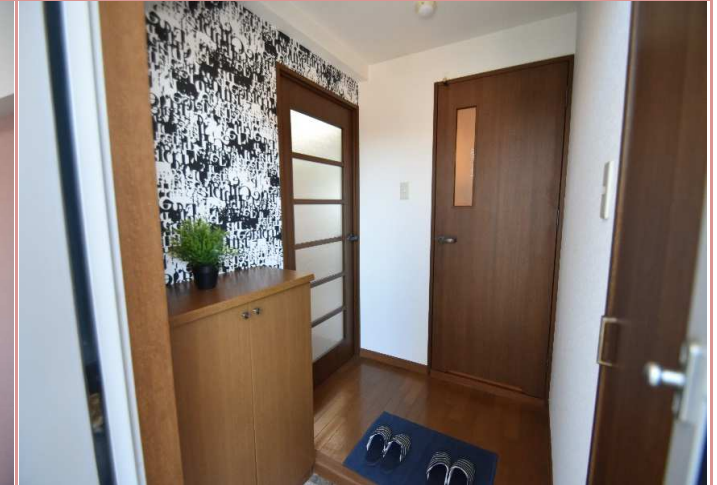
玄関の間口が広がって地味に嬉しい。 今回はデザイン性の高いクロスを選択しました🌀