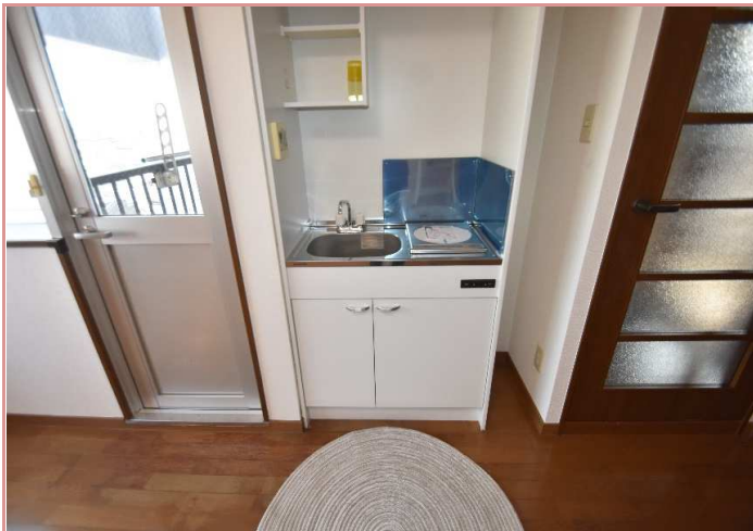
キッチン本体ごと、IHコンロのものに新調致します♪ 新品が一番間違いありません！