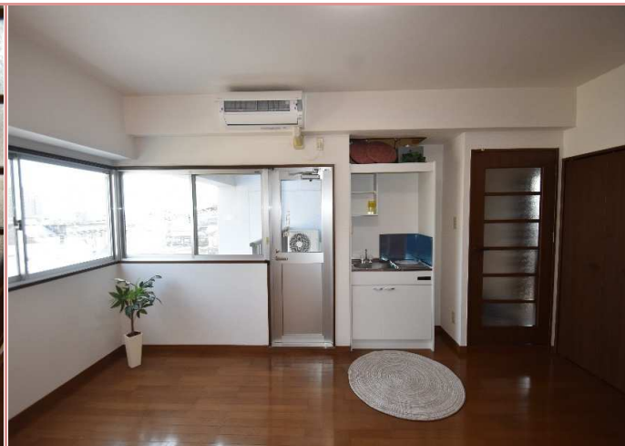
2面採光ならではの明るさと風通し☀ エアコンも新調致します🍷