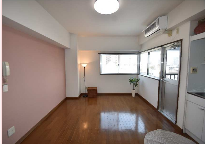
10畳あれば、色んな活用法があるうー キングサイズのベッドも置けますよ☺ 注※狭くはなりません