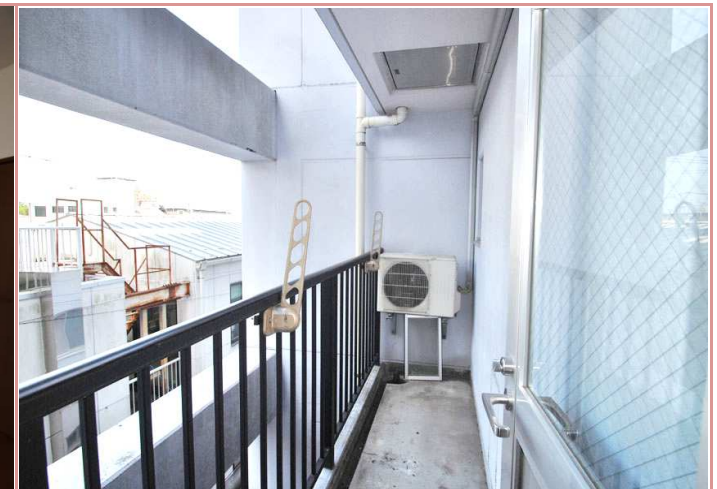
502号室のベランダは、道路に面してないので、 洗濯物やお布団も気にせず干せちゃいます👕🧺