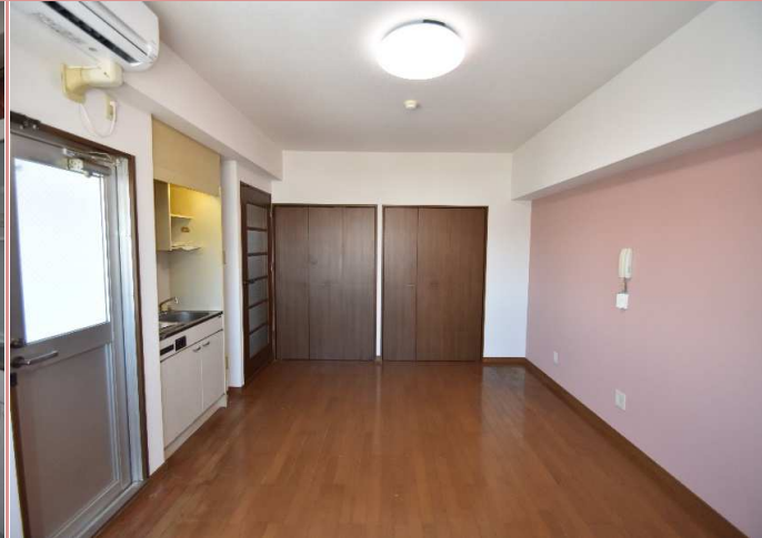
押入とクローゼットの夢の共演 ✨ 奥行きもあるので、収納ダンスまですっぽり♪