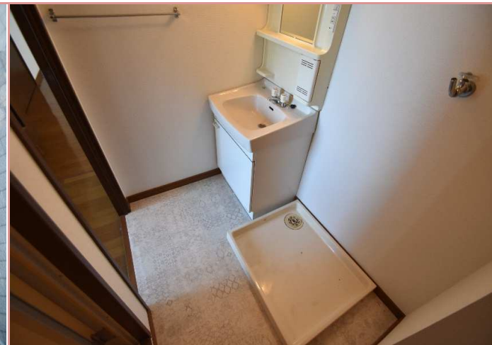
もはや必須の独立洗面台もございます😊 意識高め系の方、ココ！萌えポイントですよ！💧