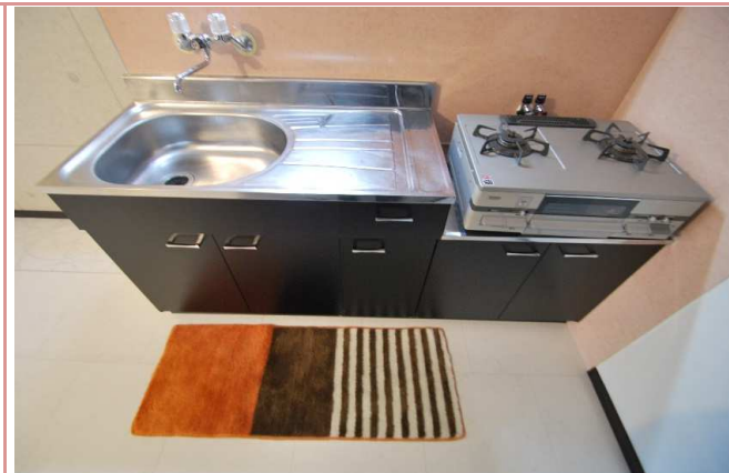
キッチン 使い勝手の良いキッチン！