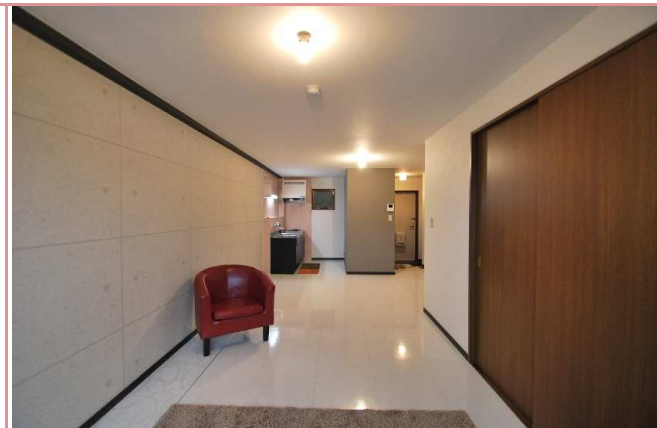
自慢のリビングです。