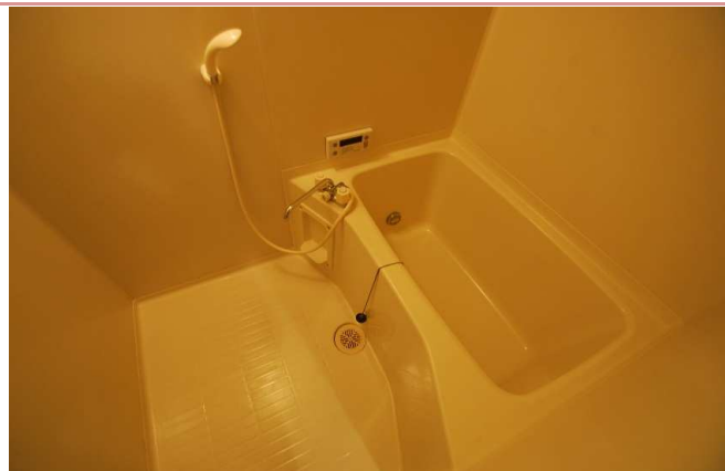
お風呂 余裕のある広さ・追い焚き給湯です！