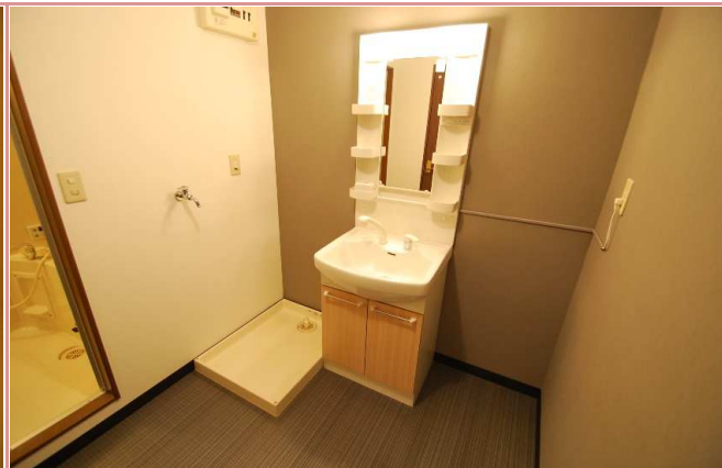
脱衣所 脱衣所も余裕があります。