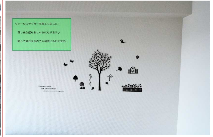
ウォールステッカー