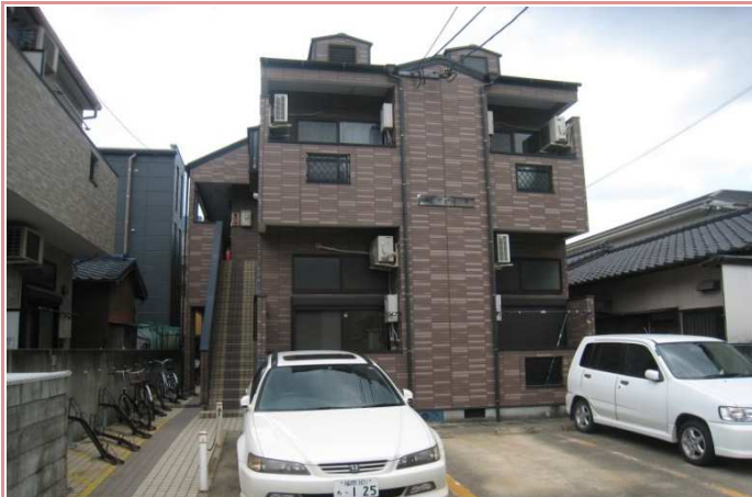
駐車場条件 満車(空予定なし)

《物件個別の特徴など:リフォームやこだわりの設備等》※建物仕様などが異なる場合は、現況を優先させていただきます。