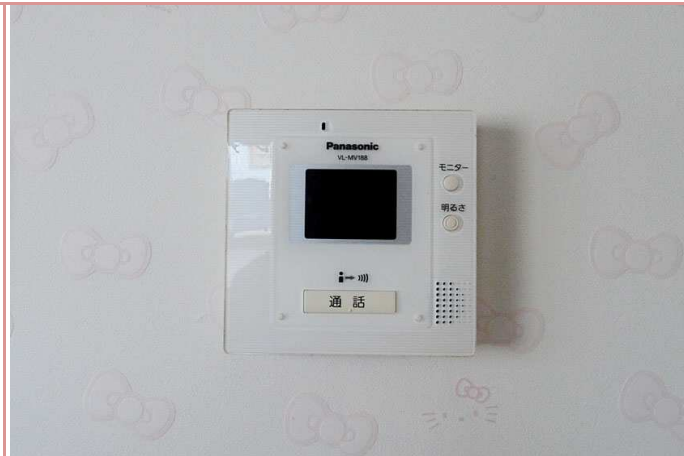
モニター付きインタフォン