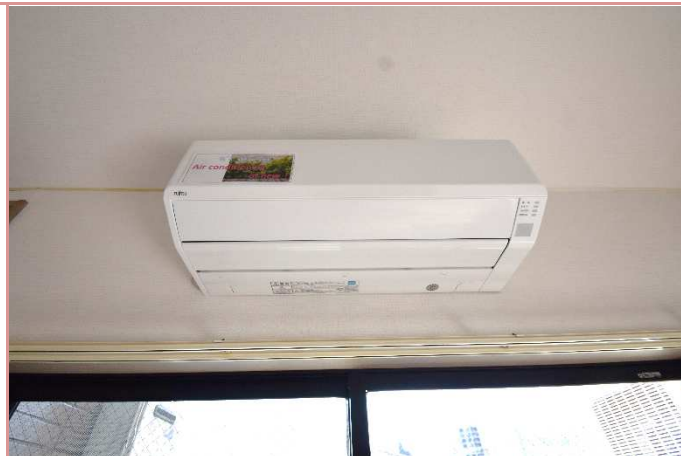
エアコン ハイパワーなエアコンに交換済み！(2.8kw)