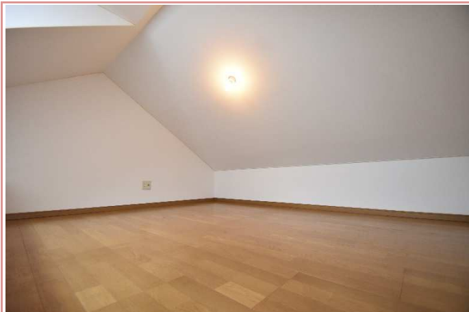
ロフト 広さは充分です