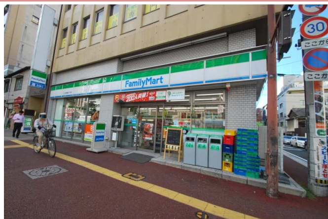
コンビニまで徒歩1分