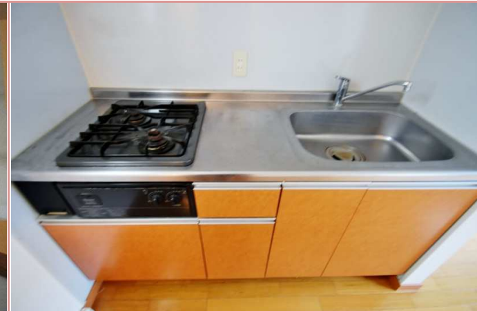
2口ビルトインコンロ付になっております。