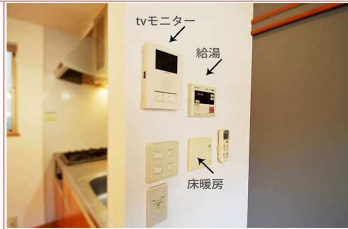
設備も充実しております。