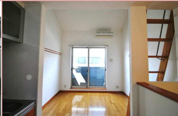
メゾネット+ロフト付で天井高になっております。