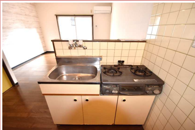
キッチン ※ コンロは付きません