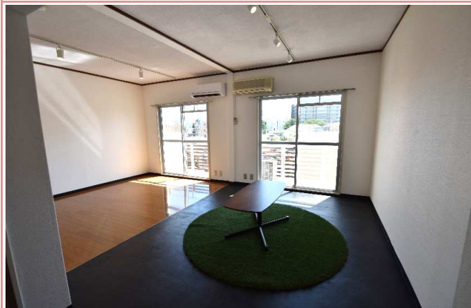
ライティングレール仕様！