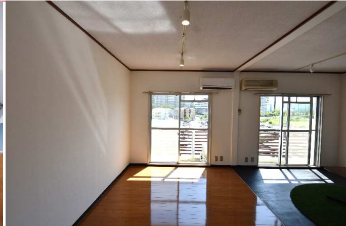
洋室 2面窓で明るいです☆